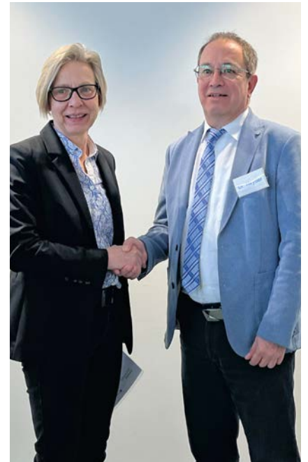
Mit Handschlag besiegelt: gemeinsam neue Wege gehen

Ziel ist es, unsere internen Abläufe zu optimieren und die Zusammenarbeit mit unseren Mitgliedsunternehmen noch effizienter zu gestalten. Während der Umstellungsphase kann es vereinzelt zu kurzen Einschränkungen in der Erreichbarkeit kommen. Dafür möchten wir bereits heute um Verständnis bitten. Über die genauen Termine sowie mögliche Anpassungen in den Kommunikationswegen werden wir Sie zeitnah informieren.